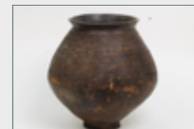
Urne cinéraire du 7ème siècle avant J.C.

Entre 1954 et 1959, Felice Pattaroni fouille une vaste nécropole, utilisée entre le 5ème siècle avant J.C. et la fin du 4ème siècle après J.C.. Les fouilles ont mis au jour au moins 126 sépultures, dont 5 pouvant être attribuées à la fin de la première partie de l'âge du Fer. Le mobilier de la tombe 7 appartient à cette époque et a été déposé dans une enceinte en pierres, à proximité de la riche tombe 15. Les cendres du défunt se trouvaient dans le pot décoré avec des bandes à décor lissé, qui renfermait également un fragment de bracelet et deux petites plaques en bronze et fermé par un large bol qui faisait office de couvercle. L'analyse des structures de la tombe et des mobiliers permet de reconstituer de nombreux aspects de la vie de la population installée dans la région à partir du 2ème siècle avant J.C., lorsqu'elle a évolué de communauté celtique à une cité entièrement romanisée et vitale jusqu'à l'Antiquité tardive. Au fil du temps, même les rites funéraires pratiqués dans la communauté ont évolué : le rituel des dépôts le plus ancien est celui de l'inhumation, typique des populations alpines. Les tombes du milieu du 1er siècle avant J.C. indiquent l'introduction du rite de la crémation qui sera pratiqué pendant toute l'époque romaine, jusqu'au 4ème siècle après J.C., lorsqu'on assiste à un retour à la pratique généralisée de l'inhumation.