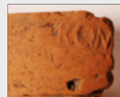
Sceau ROM (—) sur le bord d'une amphore Dressel 6B

À partir de la fin de la République romaine, se crée un système intense de marché organisé sur des voies maritimes et fluviales précises, plus sûres et rapides par rapport aux voies terrestres. Grâce à de nombreuses importations en provenance de Padanie et de la Méditerranée (en particulier adriatique et orientale), Gravellona Toce s'insère dans un système basé sur l'axe lié au Pô et aux voies hydriques exploitées dans le Tessin et la région de Verbano. Cependant, les apports de la Méditerranée méridionale dans l'Antiquité tardive ne manquent pas.