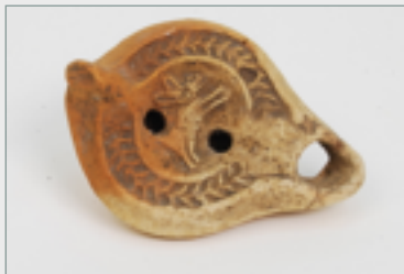
Lampe à huile d'imitation africaine

Dessin autographe de Felice Pattaroni relatif à la tombe infantile 1 bis